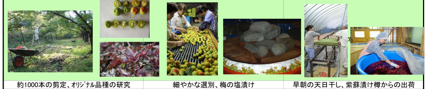
約1000本の剪定、オリジナル品種の研究 細やかな選別、梅の塩漬 早朝の天日干し、紫蘇漬け樽からの出荷