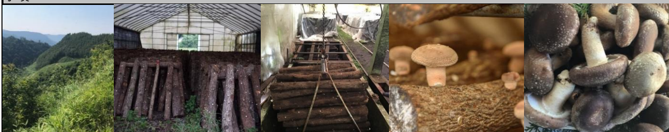
①原木となる樺の山 ②本伏 ③ほだ木の浸水作業 ④発生 ⑤収穫した肉厚な椎茸